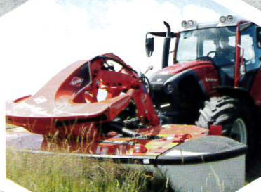
GADANHEIRA FRONTAL FC3125