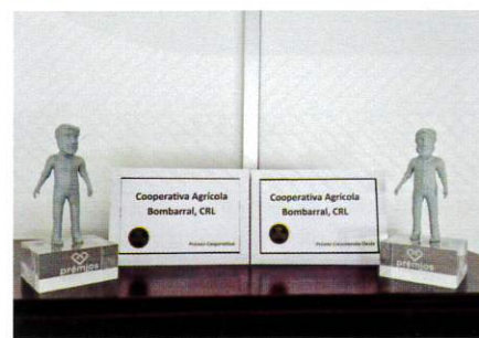
2. PRÉMIO DA COOPERATIVA AGRÍCOLA DO BOMBARRAL

desenvolvido na Cooperativa Agrícola do Bombarral, por uma equipa de profissionais empenhados, contribuiu, por um lado, para promover a redução da poluição ambiental e o cumprimento dos normativos legais, e por outro, com os prémios recebidos, ajudar financeiramente duas entidades locais de solidariedade social e humanitária".