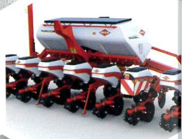
SEMEADOR MAXIMA 3